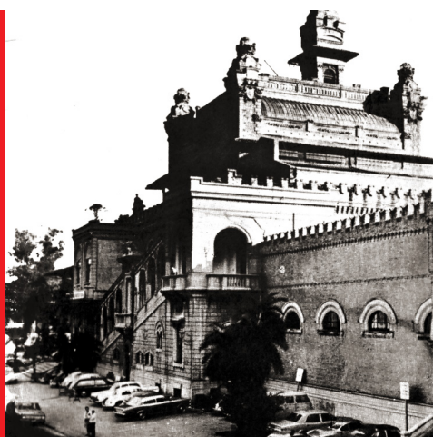
Sede do antigo Departamento das Delegacias Regionais de Polícia da Grande São Paulo (DEGRAN) no Palácio das Indústrias