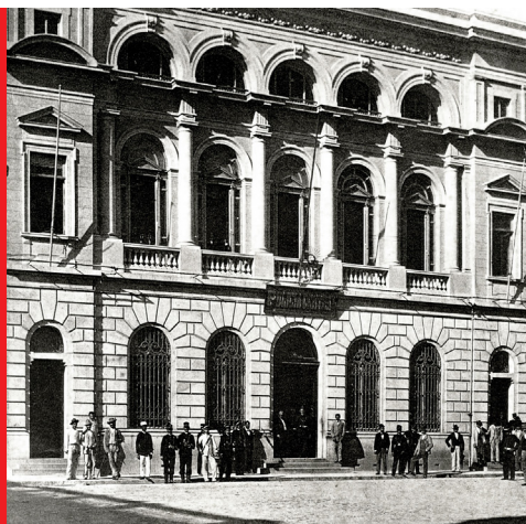
Repartição Central de Polícia em 1891, no Pátio do Colégio